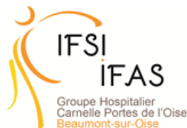
IFAS de Beaumont-sur Oise